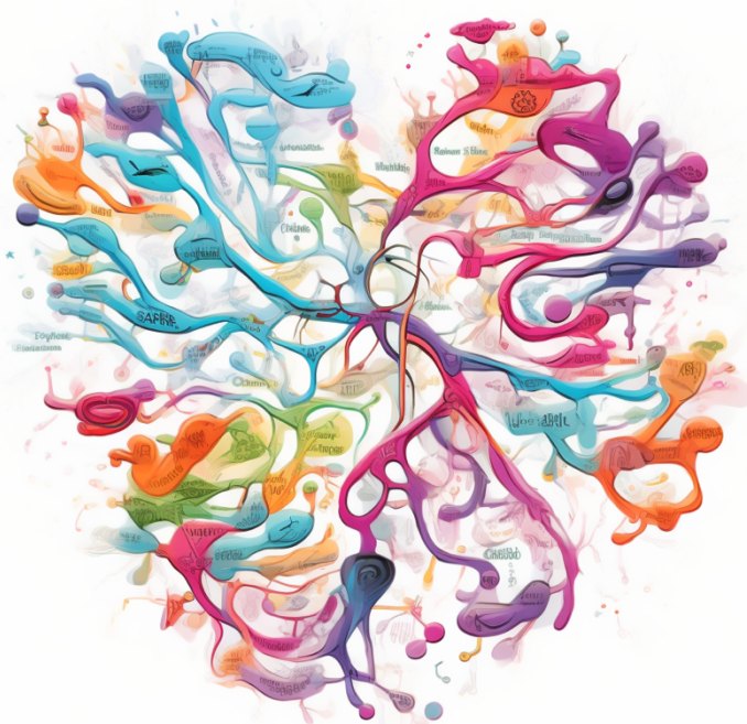
Immagine realizzata da Midjourney.com

Oltre ai software dedicati, possiamo utilizzare anche applicazioni più generiche come Microsoft PowerPoint o Google Slides per creare mappe concettuali. Questi strumenti offrono funzionalità di disegno e organizzazione che possono essere sfruttate per creare mappe concettuali semplici e intuitive.