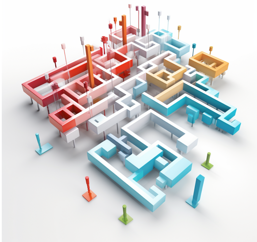
Immagine realizzata da Midjourney.com

Una delle prospettive future delle mappe concettuali riguarda l'utilizzo di tecnologie avanzate. Ad esempio, l'intelligenza artificiale potrebbe essere utilizzata per analizzare e suggerire relazioni tra concetti, facilitando la creazione e l'organizzazione delle mappe concettuali. Inoltre, l'utilizzo di strumenti digitali e applicazioni mobili potrebbe rendere le mappe concettuali più accessibili e interattive, consentendo la collaborazione e la condivisione delle mappe in tempo reale.