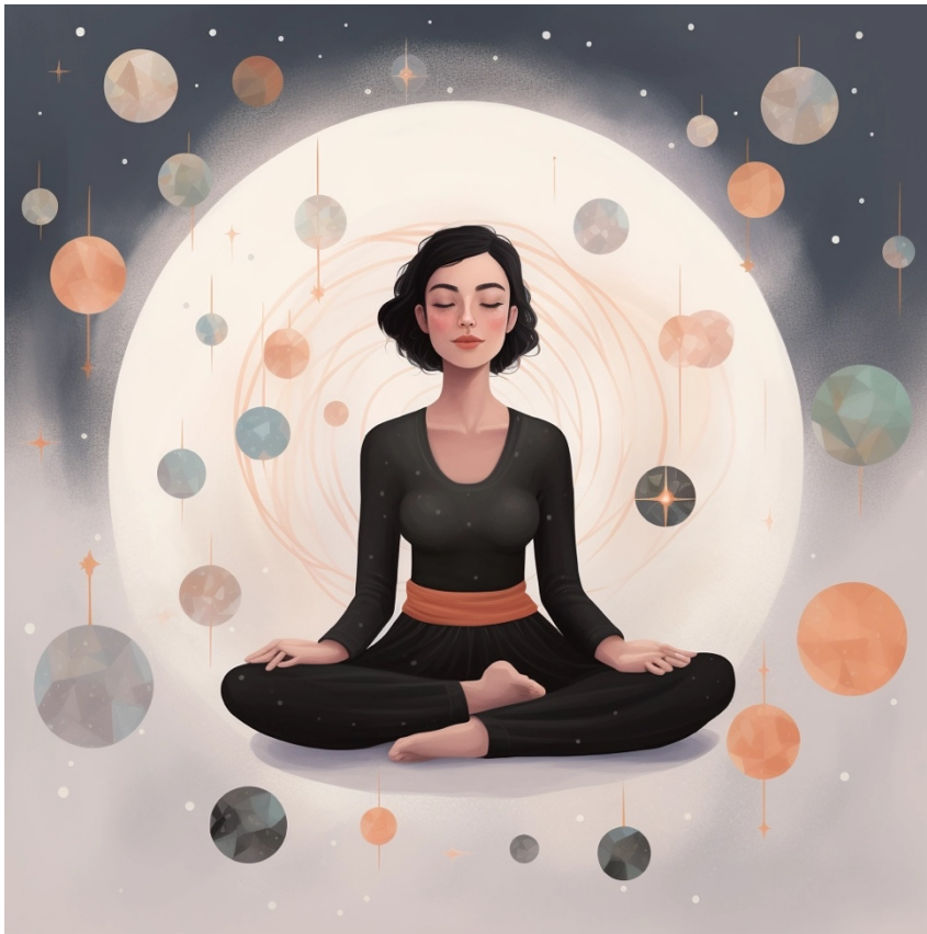
Immagine realizzata da Midjourney.com

Le mappe concettuali possono anche essere utilizzate per identificare e superare gli ostacoli che possono presentarsi durante il tuo percorso di sviluppo personale. Puoi rappresentare visivamente le sfide che incontri e le possibili soluzioni o strategie che puoi adottare. Questo ti aiuta a prepararti mentalmente e a pianificare in anticipo come affrontare le difficoltà che potresti incontrare lungo il cammino.