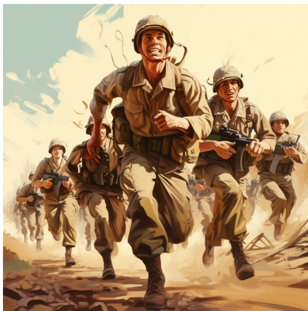
Immagine realizzata da Midjourney.com

Oltre all'uso individuale delle mappe concettuali, queste possono essere utilizzate anche in attività di gruppo e di collaborazione. Gli studenti possono lavorare insieme per creare mappe concettuali condivise, che favoriscono la comunicazione e la cooperazione tra i membri del gruppo. Questa collaborazione promuove anche lo sviluppo di competenze sociali e di lavoro di squadra, che sono essenziali nel mondo moderno.