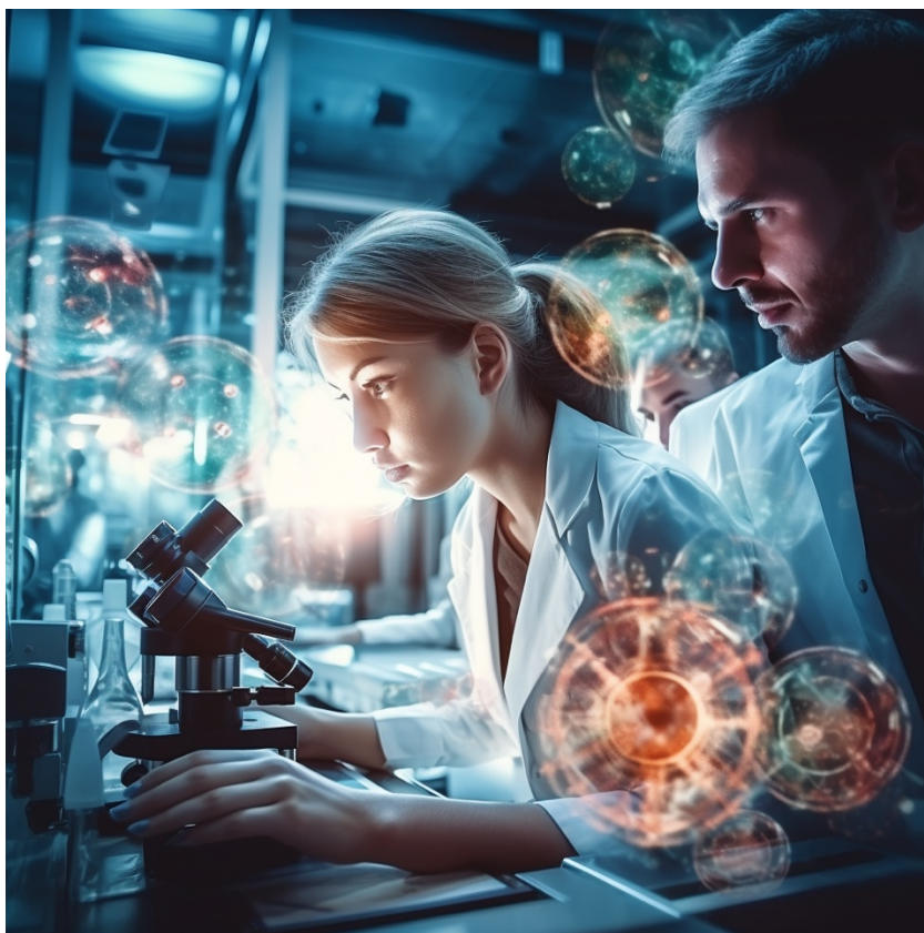
Immagine realizzata da Midjourney.com

Inoltre, le mappe concettuali possono essere utilizzate per identificare le lacune nella conoscenza scientifica e individuare nuove strade di ricerca. Creando una mappa concettuale di un determinato campo di studio, i ricercatori possono individuare le aree in cui le connessioni sono più deboli o le informazioni sono limitate. Questo aiuta a identificare le aree di ricerca che possono essere esplorate ulteriormente o le domande che richiedono ulteriori indagini.