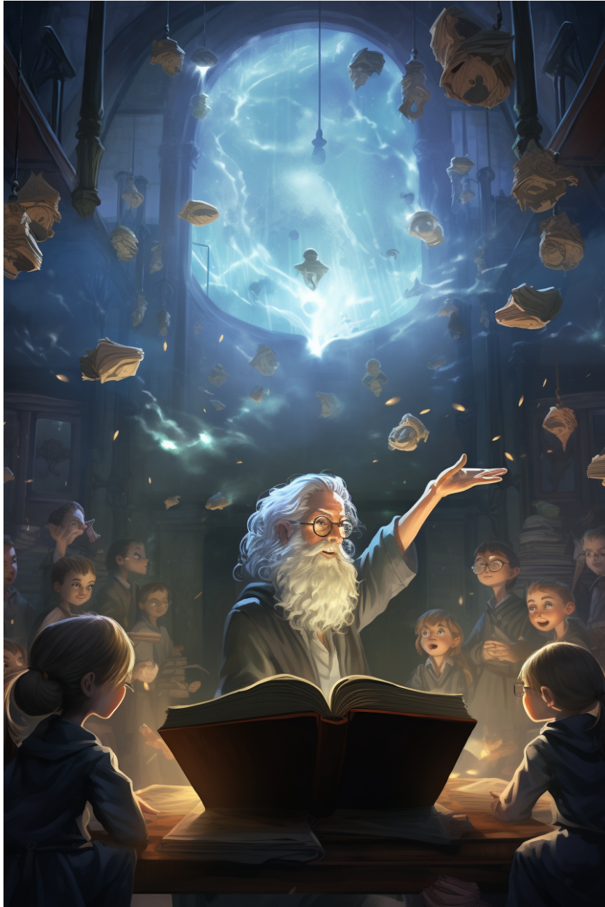
Immagine realizzata da Midjourney.com

Benvenuti nell' incantevole mondo delle rappresentazioni grafiche della conoscenza! In questo libro, intraprenderemo un viaggio per esplorare il potere e la bellezza della mappatura concettuale, uno strumento visivo che ci aiuta a organizzare, comprendere e comunicare informazioni complesse in modo chiaro e conciso. Dall'istruzione al business, dalla scienza allo sviluppo personale, la mappatura concettuale è diventata una risorsa inestimabile per gli individui e le organizzazioni che cercano di sbloccare il potenziale delle loro idee e conoscenze.